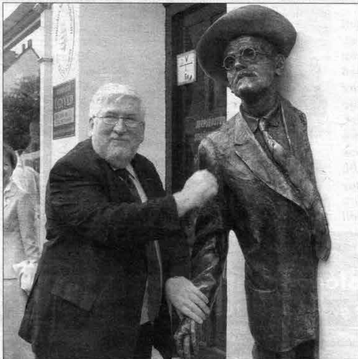
Két ír úr: a nagykövet üdvözli a leplezett írórt